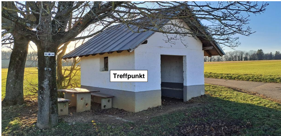
Abbildung 1: Schutzhütte auf der Plattach bei Gönningen